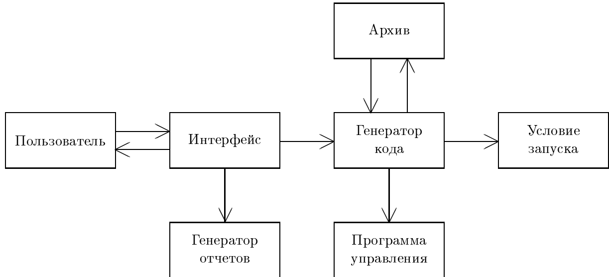
Рис. 3. Структура конструктора программ управления.